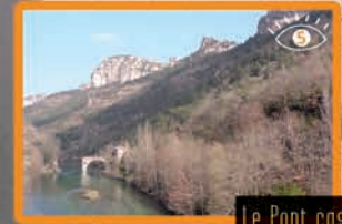
Le Pont cassé