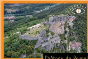
Château de Peyrelade