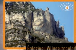
Églazine, Village troglodyte